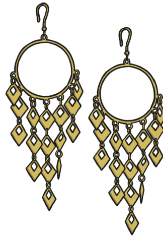
les boucles d'oreille